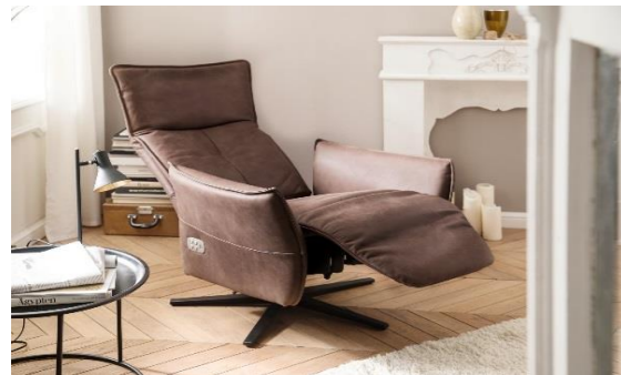
Funktionssessel mit Rückenoptik 1 im Bezug Leder