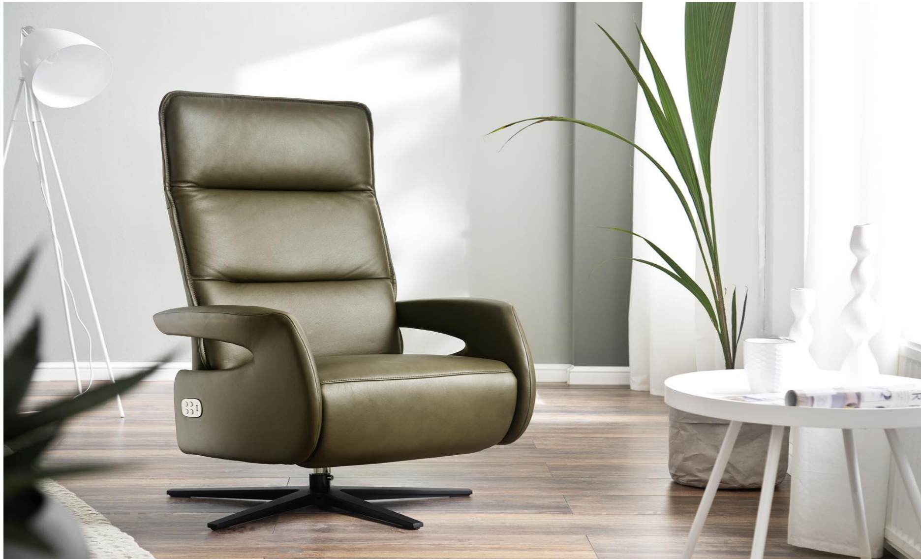
Funktionssessel mit Rückenoptik 2 im Bezug Leder oliv